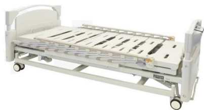
検定付3モーター電動スケールベッド

出展期間中は来場者の皆様に実際に触れ、座ってもらうなどを通じ、当社の製品への理解を深めていただく機会を提供しております。