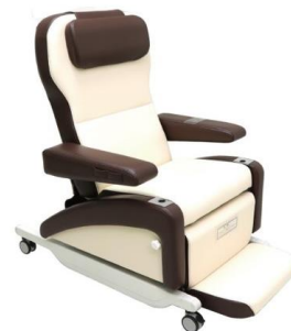
3モーター電動チェア