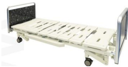
3モーター電動ベッド